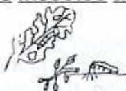
Masticadores de tallos y hojas